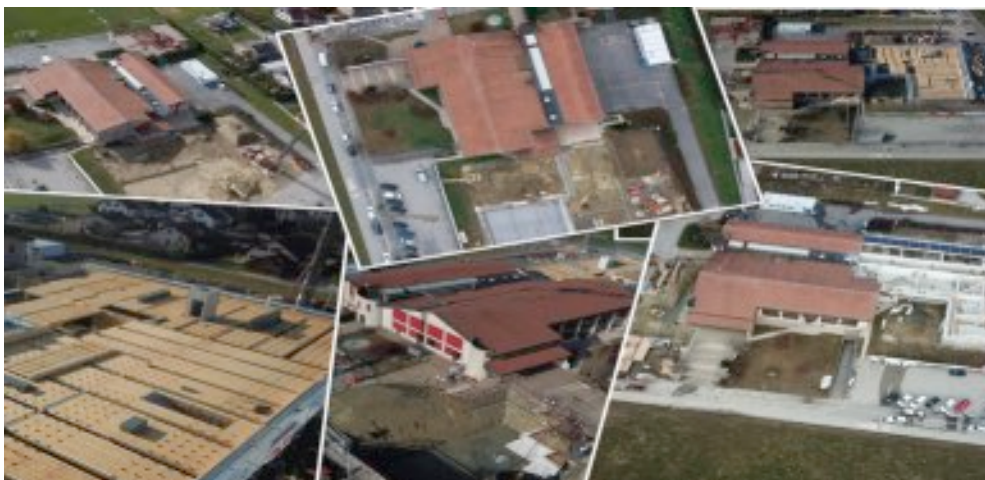
COMPLEXE COMMUNAL - AVANCEMENT DES TRAVAUX